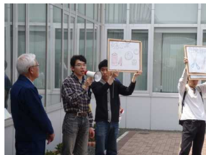
ごみの分別の説明をするKITeco