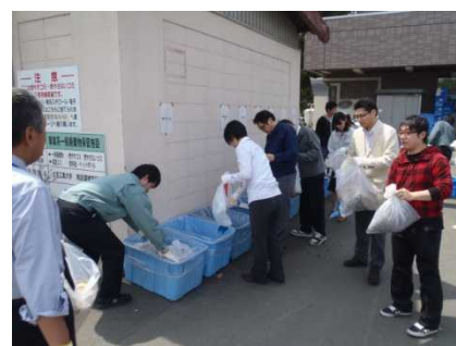
ごみ収集場所における分別の様子