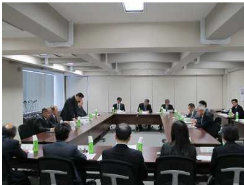
協議会総会の様子

CRCは昨年創立20周年記念事業を実施しましたが、事業実施にあたり協議会には多大なご支援をいただきました。協議会に感謝を申し上げるとともに、本学、CRCとしても地域からのご支援・ご期待にしっかりと応えていくべく決意を新たにしました。